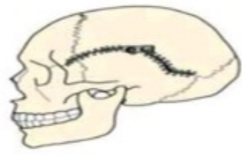
مفصل بین استخوان های جمجمه نوع مفصل: .....