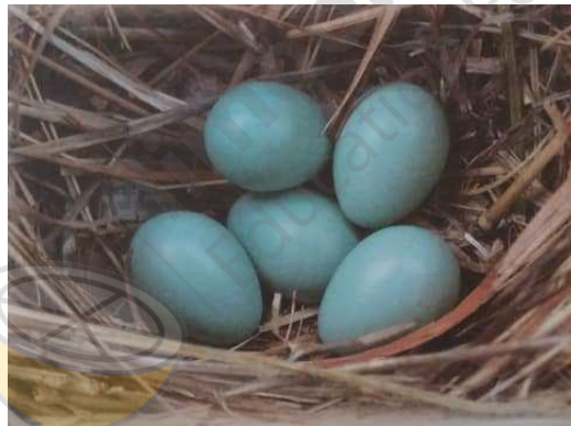
زندگی زیباست ای زیباپسند