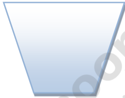
زباله ی تر