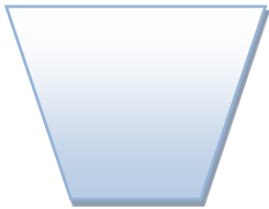
زباله ی کاغذ

روزنامه باطله ، لیوان یک بار مصرف ، پوست میوه و آجیل ، جعبه دستمال کاغذی ، بطری آب معدنی