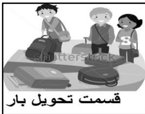
قسمت تحویل بار

با توجه به تصاویر، با نوشتن کلمه های مناسب، مکالمه ها را کامل کنید.